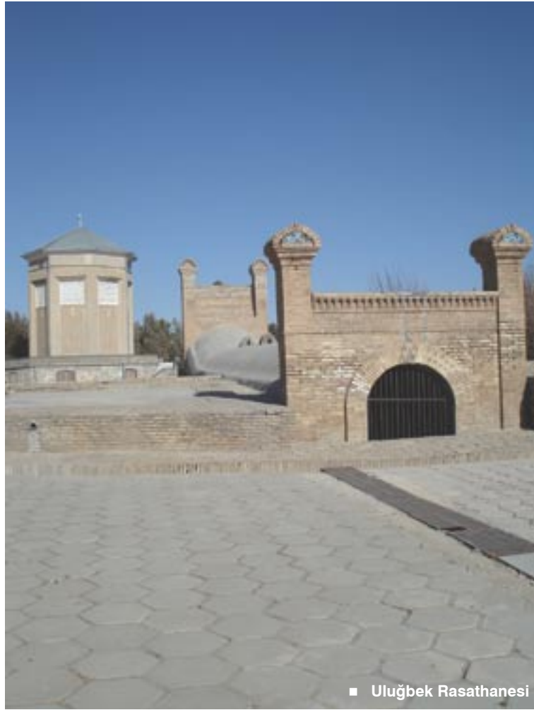
■ Uluğbek Rasathanesi

Uluğbek Rasathanesi, 46,4 m çapında, daire şeklinde dört kat olarak inşa edilmiş olup, zemin üzerinde toplam 30,4 m yükseklikteki üç kat bugün mevcut değildir. Yer altında kalan ve bugüne kadar yıkılmadan gelen bölüm içerisinde 40,21 m yarıçapında bir sekstant bulunmakta-