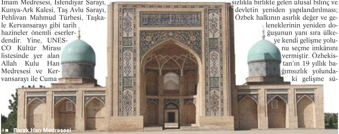
■ Barak Han Medresesi

Bu sene 1 Eylül'de bağımsızlığının 19. yıl dönümünü kutlayan Özbekistan Cumhuriyeti'nde, bağımsızlıkla birlikte gelen ulusal bilinç ve devletin yeniden yapılandırılması; Özbek halkının asırlık değer ve geleneklerinin yeniden doğuşunun yanı sıra ülkeye kendi gelişme yolunu seçme imkânını vermiştir. Özbekistan'ın 19 yıllık bağımsızlık yolundaki gelişme sü-